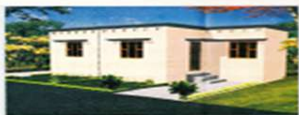
GROUND - FLOOR (૧૫ - ૩૦૭)